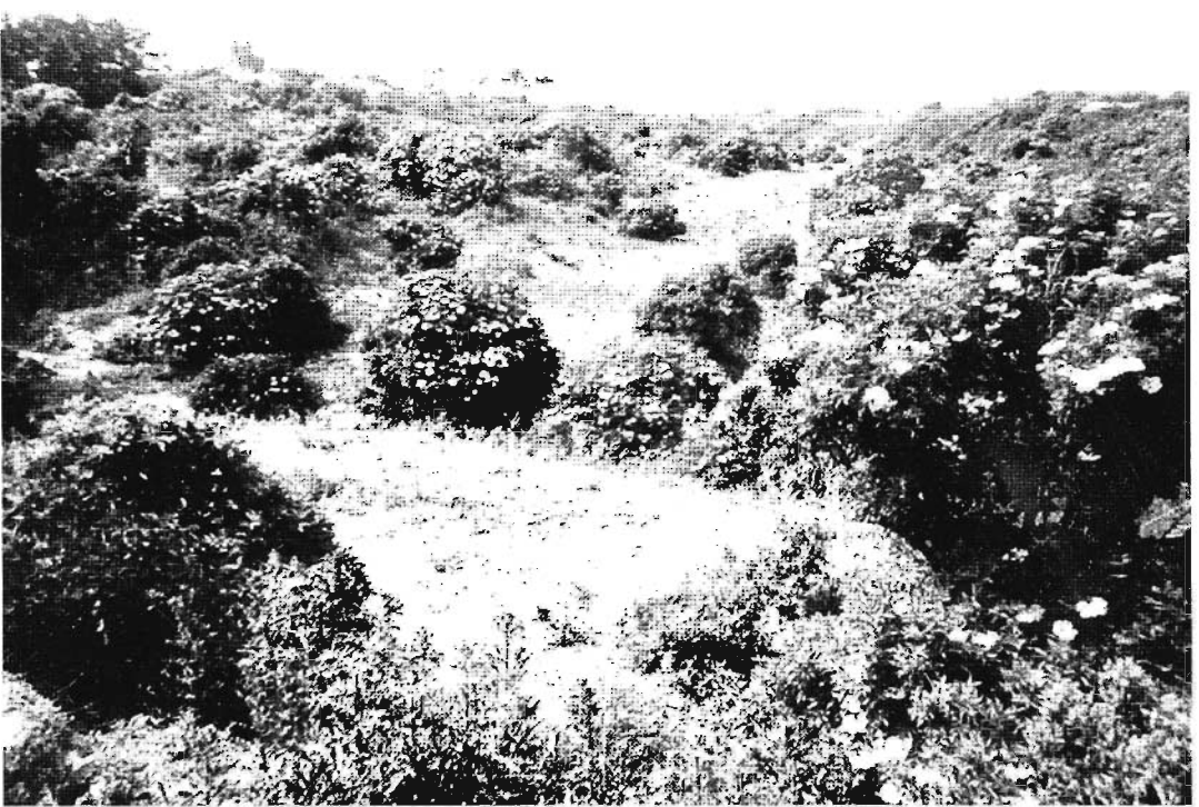
Duinlandschap met bloeiende Vlier.

gezel. Bij de in Rotterdam wonende van den Oord gingen wij als 'korte broek-vogelaars' graag op bezoek. Want hij was een toegankelijk man met een altijd luisterend oor. En, niet onbelangrijk, hij beschikte over een uitgebreide ornithologische bibliotheek waarin het goed rondneuzen was. Topstuk waren de vijf delen van 'The Handbook of British Birds', toen naar ons oordeel het meest benijdenswaardige boekbezit. Van den Oord tekende niet onverdienstelijk. Een paar van zijn tekeningen staan in 'Een eerste klas landschap'. Over hetgeen de heren bij hun excursies in september 1951 zien, staan wij thans, bijna 60 jaar later, niet paf. Het betreft veelal soorten die momenteel nog steeds karakteristiek zijn voor nazomer-excursies langs de kust van Zuidwest-Nederland. Wat 'krenten uit de pap' (citaat Delta VogelNetwerk) zijn 15 Morinelplevieren en 3 Grauwe Franjepoten op 2 september, een Visarend de 16e, wel 14 Duinpiepers de 23e en een IJs-gors op de 30e. Verder Slechtvalk, Boomvalken, en een over zee trekkend Smelleken. Curieus is de mededeling dat de Kleine Zilverreiger op de 5e kennelijk was vertrokken. Die soort was toen dwaalgast. Het valt op dat Lepelaars onvermeld blijven.