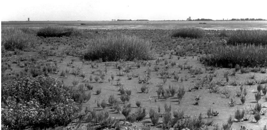
Zuidsliek aan de Brielsche Maas, 1949. Op de achtergrond rechts van het midden de stompe toren en links het baken.

Thans, bijna zestig jaar later, in een periode waarin ik er steeds meer van overtuigd geraakt ben dat een heel contingent aan zomervogelsoorten ontstellend zijn afgenomen, komen aantallen als 40 Paapjes bijna ongeloofwaardig voor. Maar om de lezer niet een complex te bezorgen hierbij de verzekering dat Luuk en ik van die melkweg aan Tapuiten, Paapjes en Bonte Vliegenvangers toen ook aardig paf stonden. En dan hadden we in feite maar een heel klein deel van De Beer aangedaan. We telden ook circa 70 Gierzwaluwen, voor zo’n aantal aardig laat in het seizoen en voor ons een bevestiging dat er iets ongewoons aan de hand was. Trouwens, later die maand, op 22 september, vlogen er nog steeds Gierzwaluwen boven het Groene Strand.