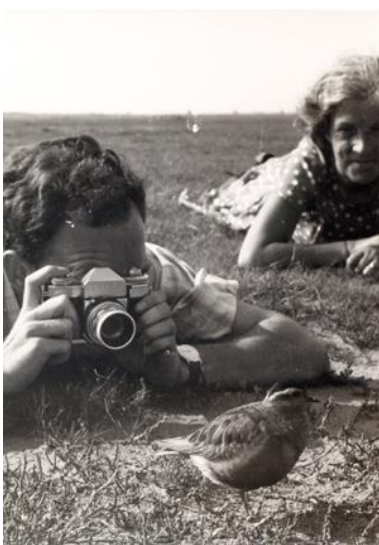
Karakteristiek tafereel op De Beer: een morinel fotograferen.