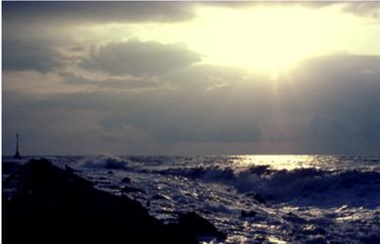
Avondstemming aan het einde van Zuidpier op 6 oktober 1956. Al bij normaal hoogwater kwam de Zuidpier onder te staan, met als gevolg dat er op de betonplaten algvorming plaatsvond, waardoor de pier spiegelglad was. Om het einde van de pier te bereiken was dus nogal een tijdrovend waagstuk.

Luuk en ik hebben er een tijd gestaan, in opperbeste stemming. Het afscheid viel niet mee. Het schemerde toen we begonnen aan de wandeling terug naar de Blencken. Het scooterritje naar Rotterdam verliep in het duister. Als reactie op de glorierijke middag had ik mij toen al voorgenomen The Popular Handbook of British Birds aan te schaffen, het boek waar ik bij boekhandel Voorhoeve en Dietrich aan de Nieuwe Binnenweg in Rotterdam al een paar maal weifelend mee in mijn handen had gestaan. Dat gebeurde. Het was een verwoestend dure aankoop. Toen ik een paar jaar later in Engeland was, kreeg ik te horen dat de Britse vogelaars dit boek aanduiden als ‘the poor man’s Handbook’, daarbij doelend op het feit dat dit boek was samengesteld voor degenen die zich niet de aankoop van de uit vijf delen bestaande serie van hun echte Handbook konden of wilden veroorloven. Anno 1956 was die kanttekening voor mij wel ter zake. Nu naar dat Popular Handbook kijkend verschijnen stevast de beelden van die Rosse Franjepoot en dat Vale Stormvogeltje van die oktobermiddag op De Beer.