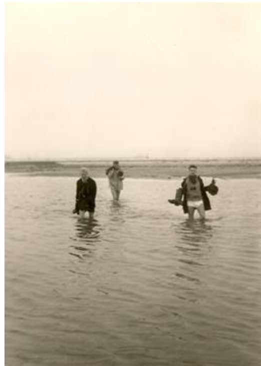
De getijdengeul die het noorden van het Groene Strand doorsneed, was bij hoogwater niet over te steken. Zelfs niet met kaplaarzen; die moesten dan uit, evenals de pantalon. Op deze foto de crossing van 25 oktober 1957, een excursie die onder andere 14 Kleine Zwanen, een Slechtvalk, drie Smellekens, Waterrallen en veel trek van Bonte Kraaien opleverde. Op de achtergrond zijn nog net de ijzeren bakens van de Zuidpier te zien.

Bovendien, in tegenstelling tot op het eiland Rozenburg, was er langs de Groene Kruisweg en vooral bij Oostvoorne en de Brielse Dam aan vogels veel te beleven, zodat het voorkwam dat een bezoek aan De Beer, het eigenlijke excursiedoel, erbij inschoot. Dat probeerden wij dan 's middags te compenseren door vanaf de Brielse Dam De Beer op te gaan, daarbij de bordjes 'Verboden Toegang' negerend en erop speculerend dat het aan het einde van de scheidingsdijk staande Schuilhuisje voor de bewaking onbemand zou zijn. Dat was niet altijd het geval.