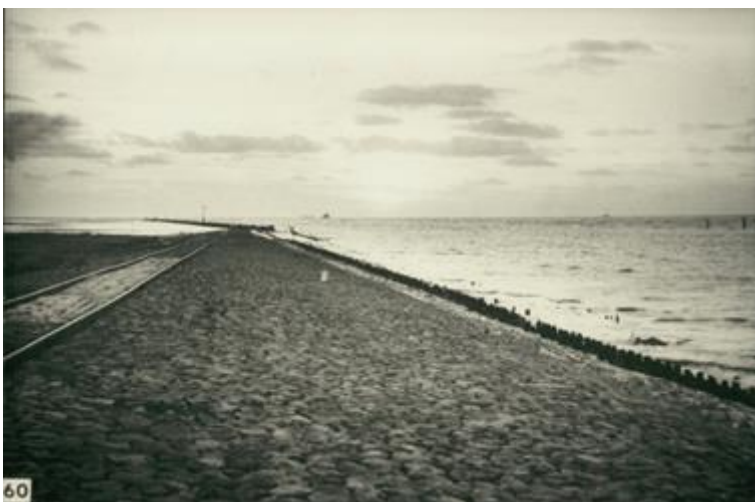
Vanaf deze plek, het begin van de Zuidpier, zagen Luuk Draaijer en Gerard Ouweneel tijdens een stevige noordwester rechts boven de Nieuwe Waterweg een Vaal Stormvogeltje vliegen.