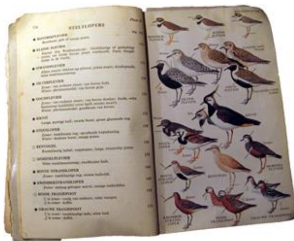
De Nederlandse versie van ‘Petersons vogelgids’ met de cirkeltjes om de mate van voorkomen aan te duiden.