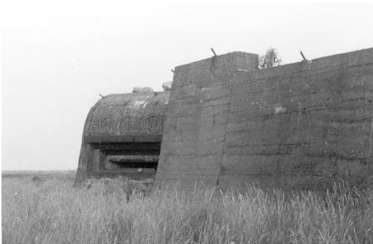
De Chinese muur was een lelijk en door zijn omvang helaas gezichtsbepalend element op De Beer. Het omvangrijke bouwwerk was als onderdeel van de Atlantikwall in de Tweede Wereldoorlog door de Duitse bezetter aangelegd.

Uit de rij van de 1956 najaarsexcursies eerst die van donderdag 6 september, een dag dat de onrust om naar de kust te gaan zo opspeelde dat alles opzij ging, op het onverantwoorde af. Die niet te weerstane drang had te maken met een influx van Bonte Vliegenvangers van een omvang die ik voordien en nadien nooit meer meemaakte. Nu, bijna zestig jaar later, lees ik verbaasd dat zich in het stadstuintje bij de ouderlijke woning in Rotterdam-Vreewijk op 3 september 1956 vijf Bonte Vliegenvangers ophielden, twee dagen later twee en dat ging zo door tot 8 september.