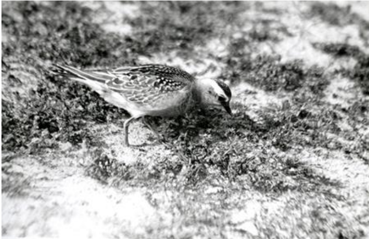
Morinelplevier op De Beer, september 1949.

Dat half uur bij de Morinelplevieren, ja die hele fijne septemberdag in de stilte en bij de vogels scherpte nog eens extra in welke misère onafwendbaar was, dat een onvervangbaar gebied op het punt stond verloren te gaan. De lange wandeling terug vond grotendeels met naar binnen gekeerde blik plaats. Ik nam mij voor de komende tijd zoveel als mogelijk terug te keren. In september 1958 werden dat vier excursies, het hele najaar van 1958 dertien. Een week later, op 13 september 1958, beroerde Hare Majesteit een knop waarop veel kabaal losbarstte en een baggermolen begon te graven.