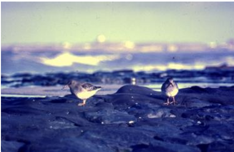
De in Noord-Europa broedende Paarse Strandlopers trekken in Nederland door en overwinteren er. Ze zijn dan vrijwel uitsluitend te vinden langs de kust en dan langs kribben en pieren. In het winterhalfjaar was het langs de Zuidpier meestal wel prijs.

De korte januaridag liep al ten einde toen we aan de moeizame semi-polaire retourtocht naar de Vogelweg begonnen. Daarna de fiets en de RTM-tram, zodat het in Rotterdam goed thuiskomen was. Van die 12 de januari 1963 werden heel wat beelden opgeslagen aan de binnenzijde van mijn ogen, die van de ijsvlakte met her en der de tientallen al omgekomen of stervende Meerkoeten het indringendst. Ruim een half jaar later zou ik pas terugkeren op De Beer, toen drie weekeindes achterelkaar om trekvogels te ringen. Rotterdam was toen al begonnen met de annexatie en liquidatie van het deel ten westen van de Chinese Muur, het deel dat wij in januari waren overgestoken en waarop zomer 1963 toch nog Grote Sterns een kolonie zouden vormen, zonder broedsucces overigens. Dat was een tijdsbeeld, evenals het feit dat we tijdens die drie nazomerweekeindes aan roofvogels slechts één Torenvalk waarnamen.