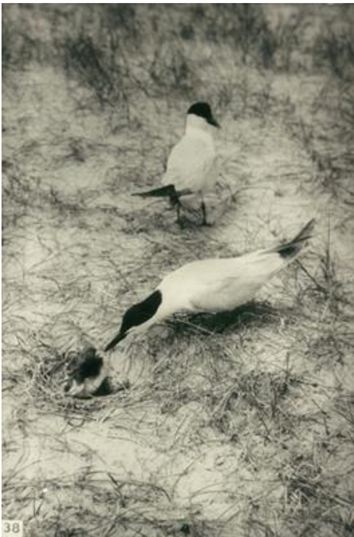
Lachsternpaar met jong op De Beer, 1949. Met de Morinelplevier was de Lachstern de specialiteit van De Beer. Dat ze daar konden broeden werd voor het eerst vastgesteld in 1931. In die tijd zaten er honderden paren in Noord-Denemarken. Hoewel cosmopoliet, broeden ze tegenwoordig in Noordwest-Europa uitsluitend in Sleeswijk-Holstein en dan nog maar met enkele tientallen paren. De kans dat ze ooit nog eens als broedvogel terugkeren naar Nederland is gering, maar niet helemaal uitgesloten.