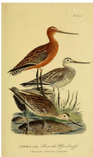
Afbeelding 4 Links De Dwergmeeuw, Larus minutus . Rechts De Rosse Grutto, Limosa lapponica , hier nog als Limosa rufa . Bron: J.A. Naumann (1820-1844) Naturgeschichte der Vögel Deutschlands , deel 13.