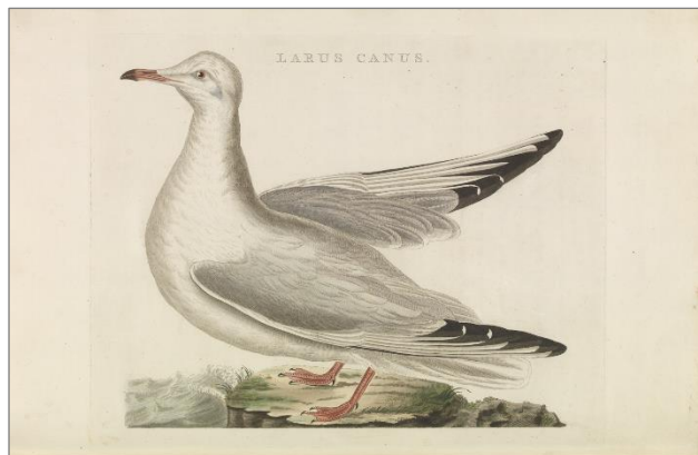
Afbeelding 3 De oudst bekende afbeelding van de Stormmeeuw in een Nederlandstalig werk stamt uit Nozeman & Sepp, derde deel uit 1797.

De conclusie moet daarom zijn dat Thijsse zich blijkbaar heeft vergist; mogelijk bedoelde hij niet de Stormmeeuw maar een andere vogel, misschien de Dwergmeeuw, zoals hierna zal worden besproken.