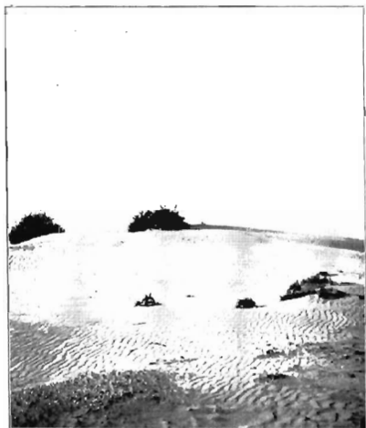
Zandverstuiving op „De Beer“