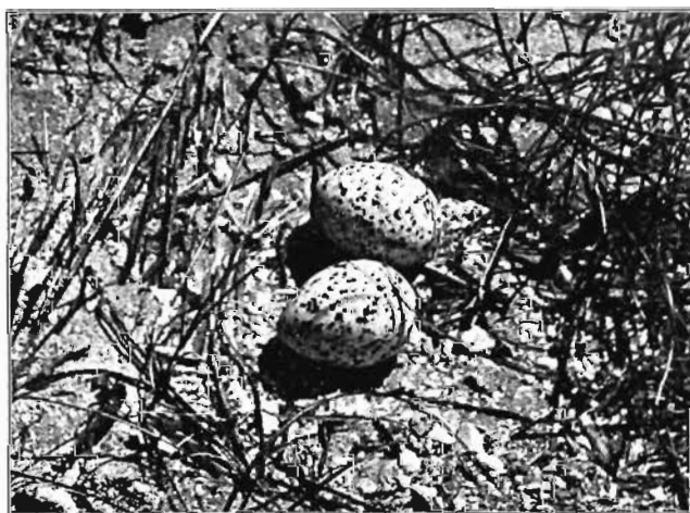
't Nest van een groote stern