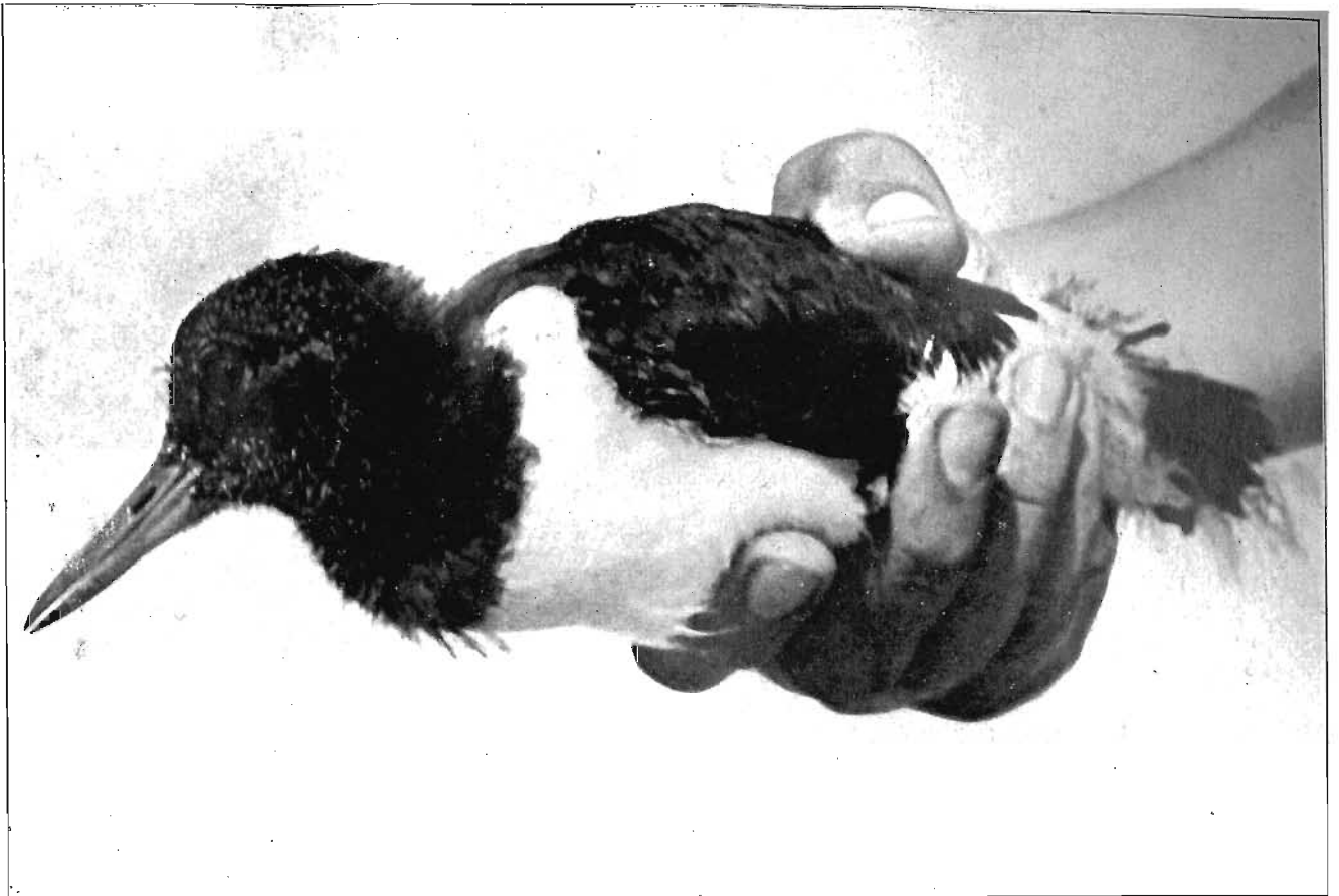
„Voor ons ontdekken we opeens een bijna vliegvluggen scholekster . . .”

te zien en dus heftig aan te vallen, terwijl de onderzinking hen geleerd heeft, dat ze van een broedende (dus zittende) stormmeeuw niets te duchten hebben. Natuurlijk zijn ook nog andere verklaringen voor hun gedrag te geven, maar in ieder geval zullen we in het komende voorjaar eens goed op de stormmeeuwen letten.