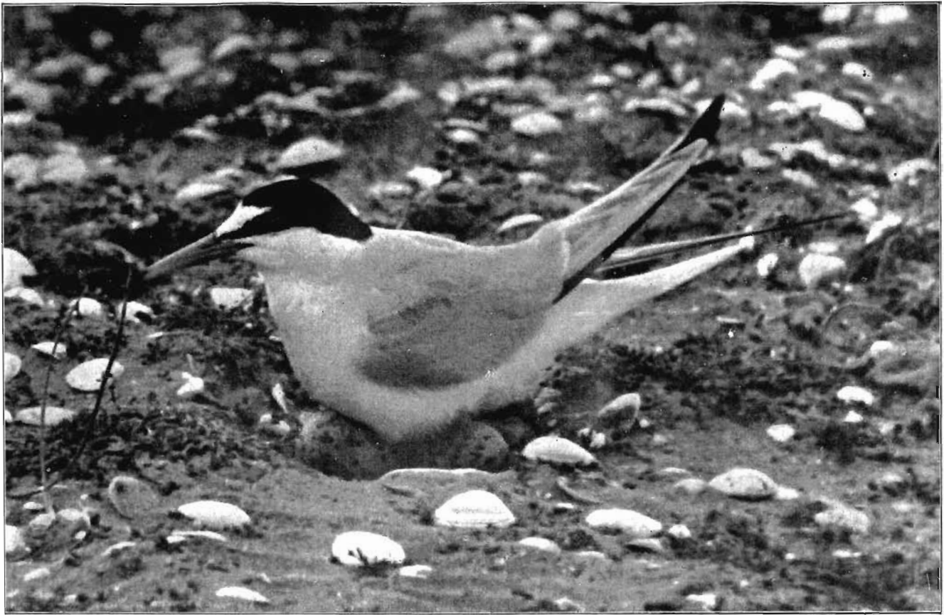
„De vischdieven blijven rustig zitten broeden...”

Een uur verloopt; de meeuw op het nest zit te soezen. Van den ander hoor noch zie ik iets; hij heeft het schijnbaar best naar z'n zin daar boven op de schuilhut. Ik had nog zoo'n hoop, dat hij naast den broedenden vogel zou gaan staan, maar dat gebeurt helaas niet; graag had ik gezien, hoe de vischdieven hier op gereageerd zouden hebben.