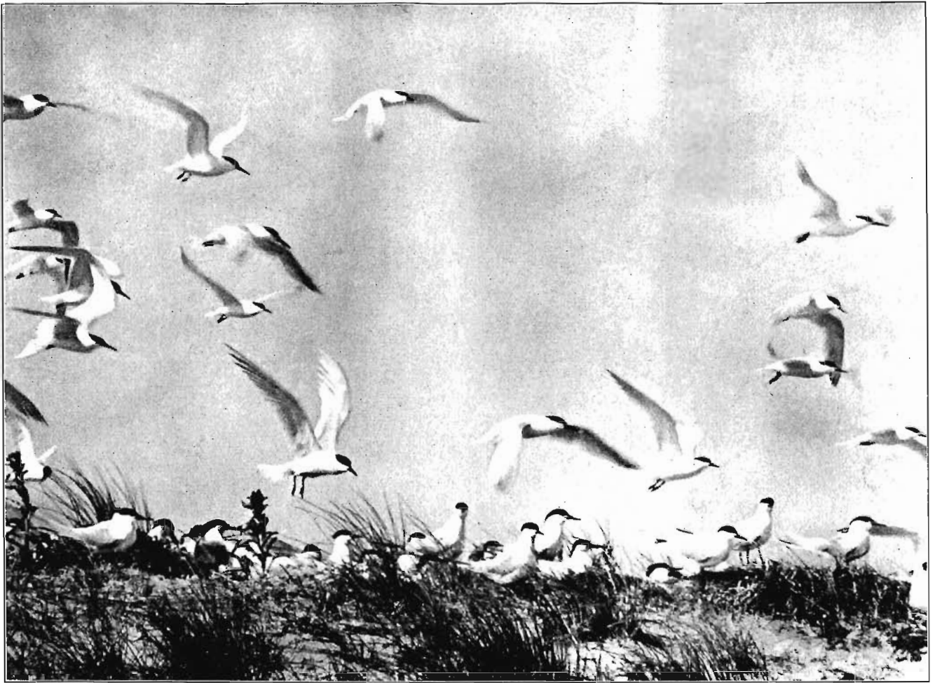
Dat is een wondermooi gezicht

terwijl de oude vogel schel roepend boven ons komt vliegen.