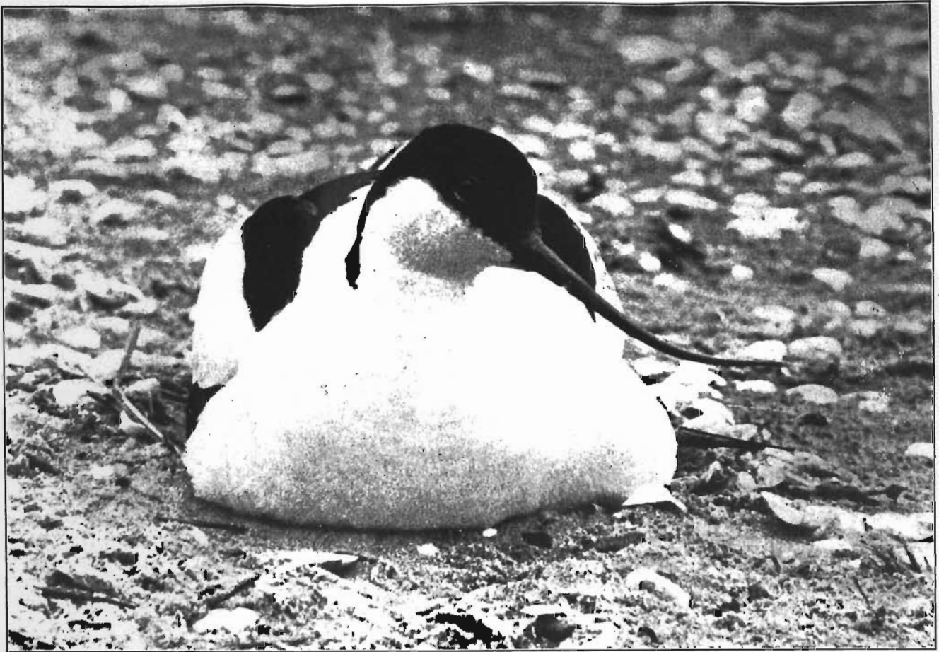
Onze komediant blijkt eigenaar te zijn van een prachtig, lichtgekleurd legsel

dichtbij, dan weer verder af. De vischdieven voor me blijven rustig zitten broeden; aan het nijldige „tjèrrrr, tjèrrrr” merk ik, dat overvliegende sterns de meeuw op zijn huid zitten. Als ik in m'n nieuwsgierigheid een poging doe om door een kiertje van het dak te kijken, beweegt de schuilhut zoo onrustbarend op z'n wankel planken-beenen, dat ik verder maar stil blijf zitten wachten. Na een paar minuten hoor ik 'n zacht plofje boven m'n hoofd en ik begriep, dat de stormmeeuw neergestreken is. Even later hoor ik enkele trippelpasjes boven me, de meeuw is opgevlogen; 'n schaduw valt op de eieren en . . . ik kan m'n oogen niet geloven: daar staat de stormmeeuw naast het nest. Een gezicht, dat ik niet licht vergeten zal: die prachtig blanke meeuw, scherp afstekend tegen de strakblauwe lucht. Het zoete windje, dat door de helm ritselt, speelt af en toe met z'n smetteloos witte borstveeren. Ik durf me niet te bewegen, als gefascineerd door het flonkerende, donkerbruine oog, dat wantrouwend naar het kijkgat van de schuilhut gericht is. Bij tusschenpoozen stoot 'n vischdief naar de meeuw, die dan met een korten snauw inelkaar duikt. 'n Heelen tijd staat de meeuw vlak boven zijn eieren