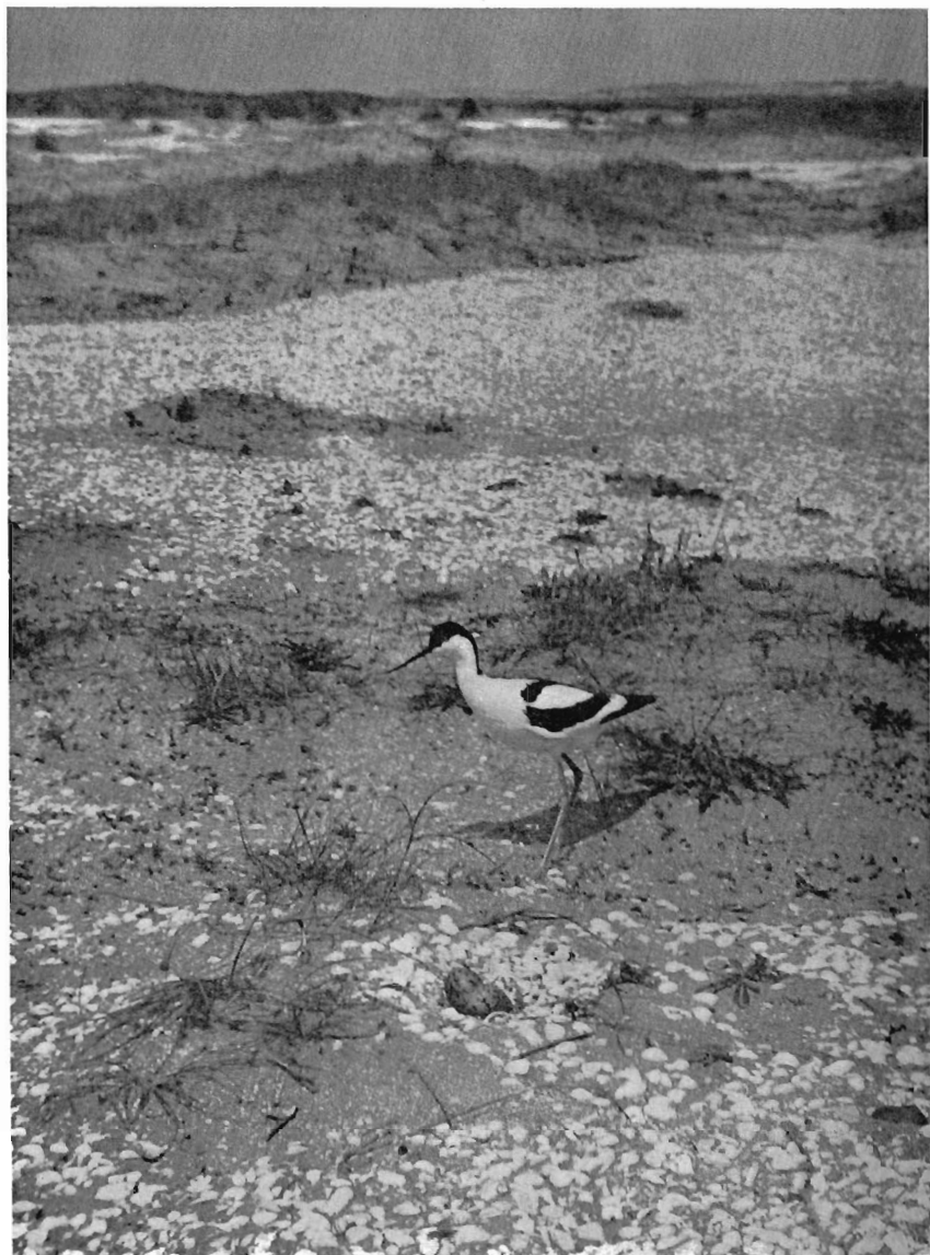
Kluut bij zijn nest op een schelpvlakte aan de zuidkant van de Beer